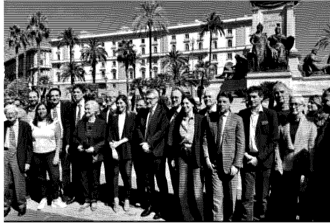
Le 34 forze politiche e organizzazioni sociali che hanno depositato venerdì scorso in Cassazione il quesito referendario

Giorgia Meloni ricorda che il principio che permette alle regioni di chiedere allo Stato maggiore autonomia è stato inserito nella Costituzione «con la riforma del Titolo V» varata nel 2001 e «approvata a colpi di maggioranza sotto il governo di Giuliano Amato. Questa riforma della Costituzione è stata l'approdo di un percorso iniziato addirittura nel 1997 dal governo Prodi e proseguito con i governi di Massimo D'Alema»