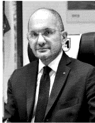
—© Riproduzione riservata—