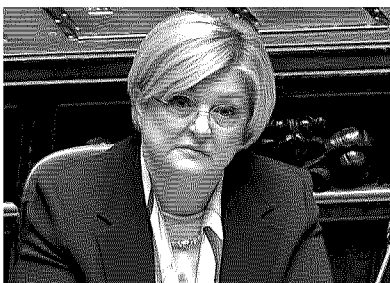
◀ Al Lavoro La ministra Calderone