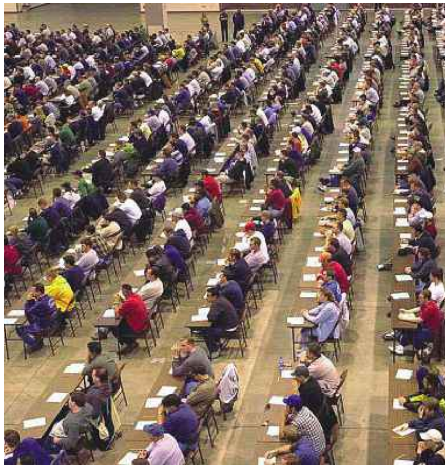
In aula Nella foto di repertorio i candidati a un concorso pubblico. L'esame sotto accusa, dei notai, risale al 2024

✓ Prima della sua rimozione, il documento è stato visto dai candidati, che hanno messo in rete gli «screenshot» del file generando commenti, accuse e annunci di ricorsi. Per chiarire la vicenda il ministero della Giustizia convocherà il Consiglio nazionale del notariato