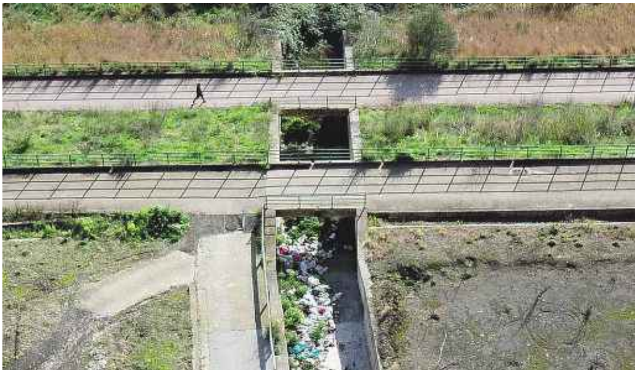
Dall'alto La vasca di contenimento costruita dopo la frana del 1998 ai piedi del Pizzo d'Alvano: erbacce e rifiuti invadono i canali pensati per mettere in sicurezza Sarno