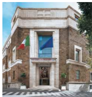
La sede del Mimit

A cura dell'Ufficio Stampa della Associazione nazionale tributaristi Lapet Associazione legalmente riconosciuta Sede nazionale: via Sergio I 32 - 00165 Roma Tel. 06-6371274 - Fax 06-39638983 www.iltributarista.it info@iltributarista.it