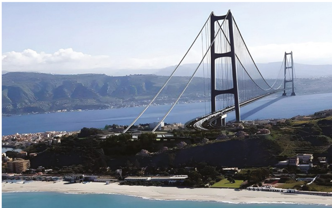
Ponte sullo Stretto. Il governo punta ad accelerare l'iter dell'opera