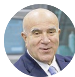
ROSARIO DE LUCA Presidente del Consiglio nazionale dell'Ordine dei consulenti del lavoro