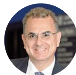
ELBANO DE NUCCIO Presidente del Consiglio nazionale dei dottori commercialisti ed esperti contabili

L'ultimo suggerimento fatto da de Nuccio in merito all'iperammortamento riguarda la semplificazione della procedura per potervi accedere: «la norma stabilisce ben tre comunicazioni. Sarebbe utile prevederne due, una all'inizio dell'investimento e un'altra, di rendicontazione, alla fine».