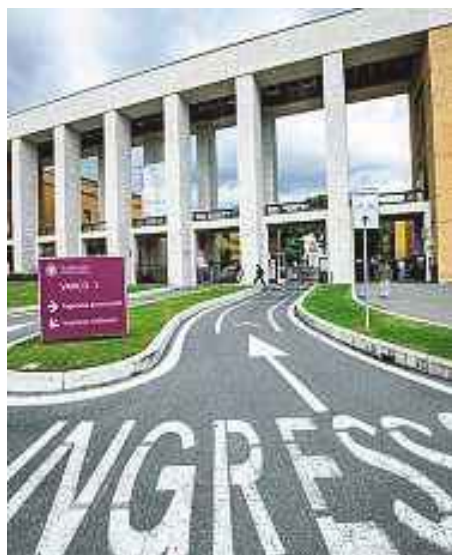
Sotto attacco L'università Sapienza era già stata colpita nel 2021

● Bloccati tutti i servizi operativi dell'ateneo. A rischio milioni di dati di studenti, docenti, impiegati e collaboratori