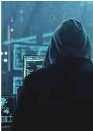
Un pirata informatico al lavoro

La Sapienza attaccata dagli hacker, non si esclude appartenenti a una crew filo-russa. La scoperta è stata fatta ieri mattina con i tecnici dell'ateneo che si sono rivolti agli specialisti dell'Agenzia per la cybersicurezza nazionale e quindi anche alla polizia postale. Gli incursori informatici hanno utilizzato un virus ransomware per prendere possesso di tutte le attività dell'ateneo che di fatto è risultato irraggiungibile dalla Rete fin dalle prime ore della mattinata. Tutto fermo.