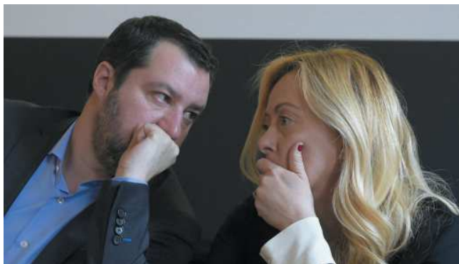
Matteo Salvini e Giorgia Meloni